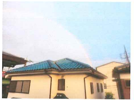
江坂さんも負けずと送って来ました。