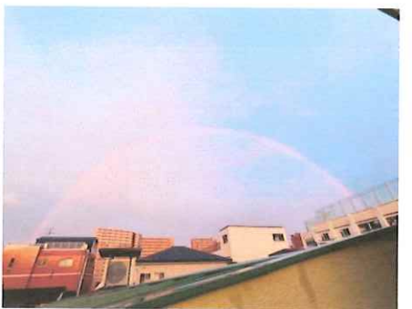
拡大にも虹の御利益がありますように願います。