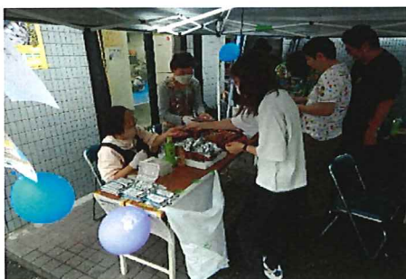
フルーツ販売 美味しそう