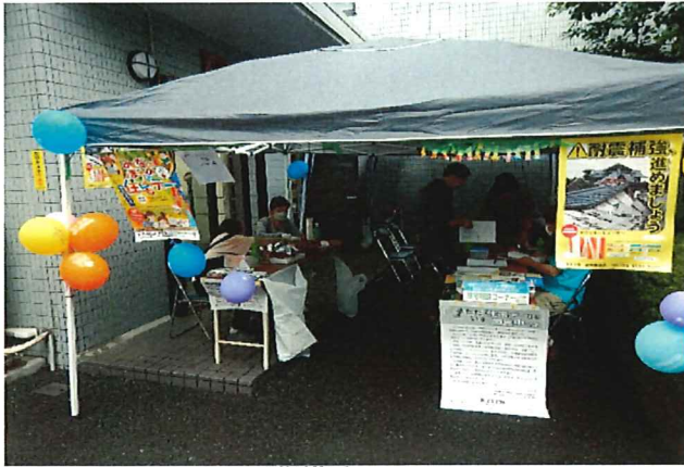
準備中 張り切ってお迎えします