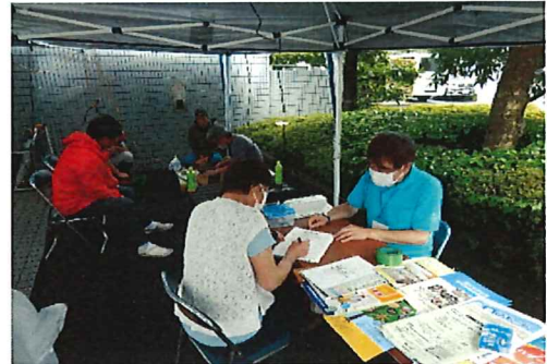
包丁受付 どれだけ来るか楽しみ