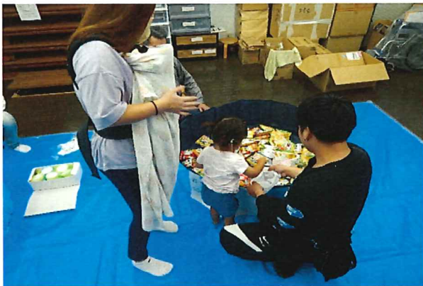
お菓子詰め放題 どれがいかに