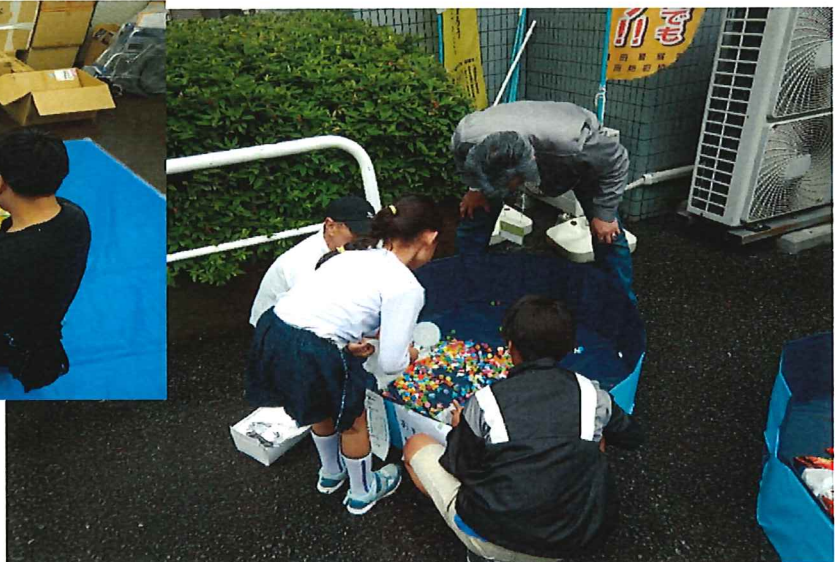
スーパーボール&ポケモンすくい ほけもんげと!!