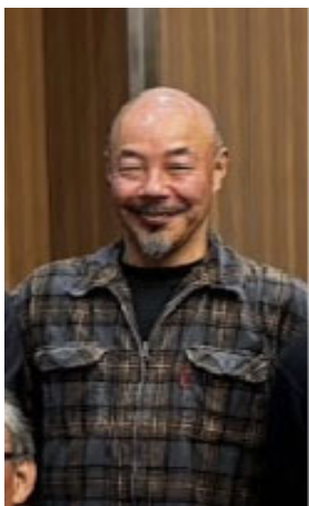
七代目 吉野分会長