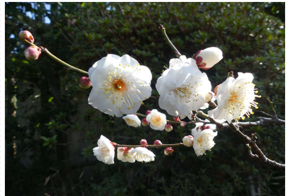
撮影日時 令和7年2月1日 撮影場所 池上梅園