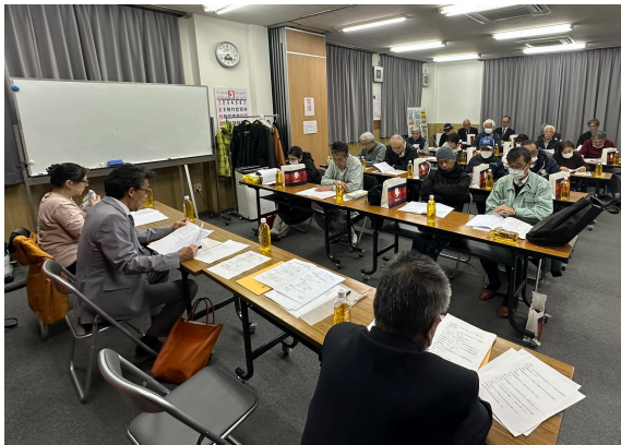
3月25日に分会総会が開催されました