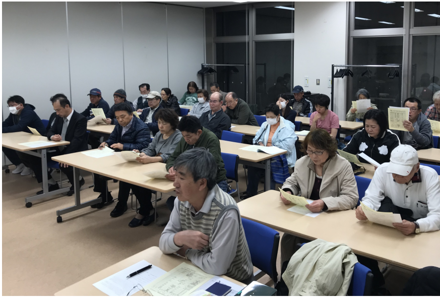
たくさんの組合員皆さんで盛り上がった分会総会