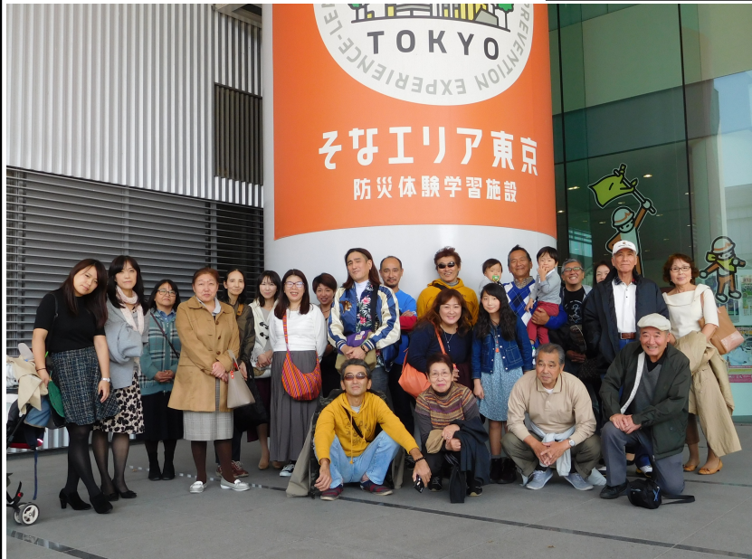
防災体験学習を笑顔で終了楽しい一日となりました