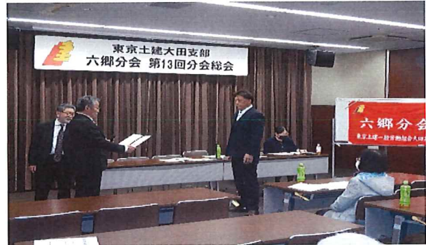
年間目標拡大達成の表彰状贈呈