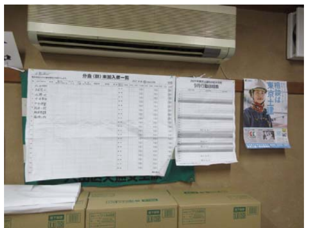
9月に行われた拡大センターの様子