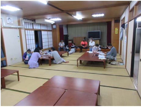
9月16日の南六郷1丁目会館による群会議