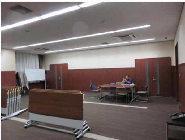
9月17日六郷推進センターによる群会議