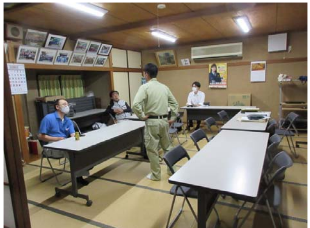
9月17日南六郷2丁目会館による群会議