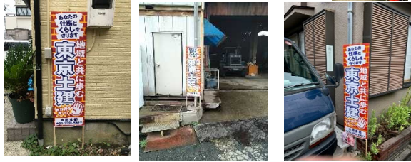
(株)亮電 (有) 福田開発 (有) 入間左官

9月4日(月) 宣伝カー行動を行いました 各組合員の皆様立て看板ご協力 ありがとうございました (有) アクアスコダマ