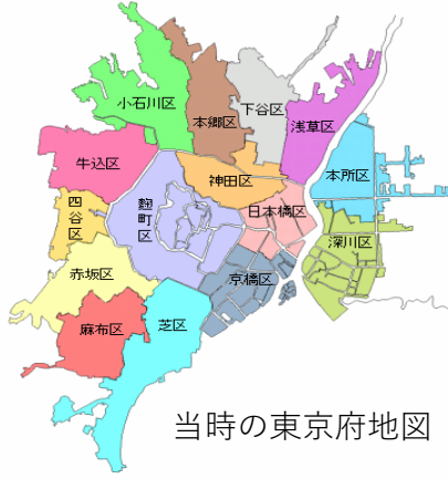
当時の東京府地図