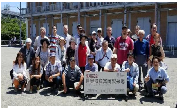
《富岡製糸場で記念撮影》

7月1日(日) はすぬま分会 ～世界遺産 バスの旅～を行いました。 世界遺産に登録された富岡製糸場の 見学に始まり、源氏庵で昼食、 こんにやくパークでは工場見学やバイキングを 楽しみました。 富岡製糸場の建築技法を眺める目は 真剣そのものでしたね。 バスの車内でも、クイズやビンゴなどの ゲームで盛り上がりとても楽しい バスの旅となりました！！ 参加された皆さん、お疲れさまでした。