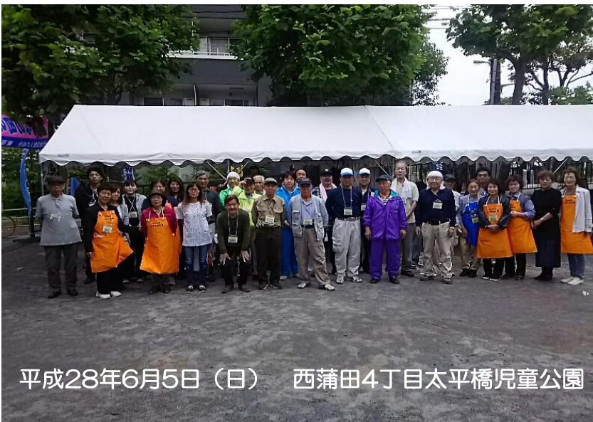
平成28年6月5日（日） 西蒲田4丁目太平橋児童公園