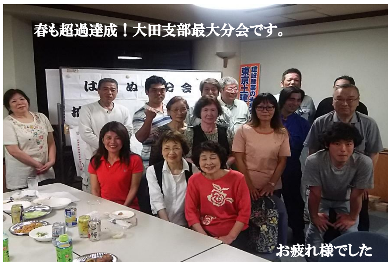
春も超過達成！大田支部最大分会です。