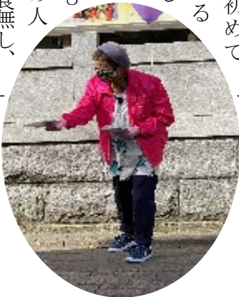
ひまわりの会の皆さんがチラシ、風船を配ってくれました

新田分会として3年ぶりとなる住宅デーを11月6日(日)、新田神社向かいの矢口南児童公園で開催しました。 分会としては初めての取り組みとなる公園での開催でしたが、天気にも恵まれ、また商店街ということもあり、なかなかの人数でしたが、飲食無し、