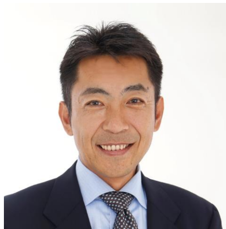
大島分会長の信任ご挨拶