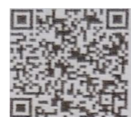
自転車用ヘルメット