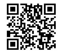
带状疱疹ワクチンを