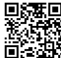
インボイス制度の危険性(動画)