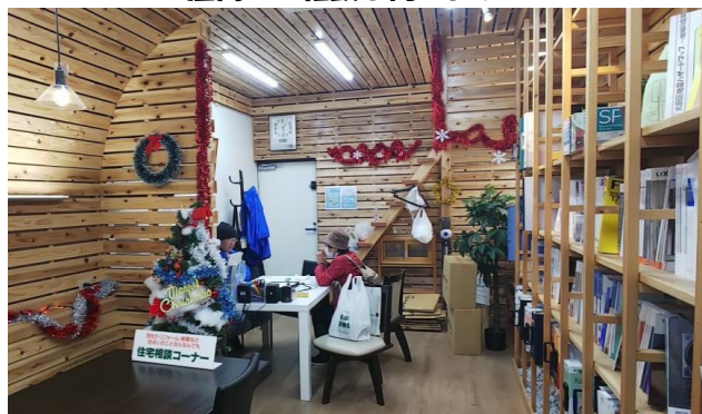
店内でご相談を伺います

又、「大田支部設計者の会」の皆さんにもご協力を頂き、毎週土日には持ち回りで店番を兼ねて蒲田で営業活動を行っています