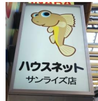
多摩川のハセがキャラ

長引く不景によって仕事が極端に減ってしまい、廃業に追い込まれたり なかには自らの命を絶ってしまう組合員も現れ始めた時に「組合組織を活かすことで組合員の仕事を増やすことが出来ないだろうか？」と、始められたのが「住宅センター」運動です