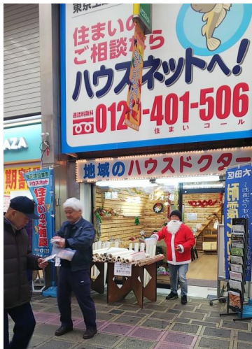
サンタの格好でちょっとしたイベントとチラシ配り

蒲田のサンライズ商店街に借りた店舗を拠点に、宣伝物等を使って営業活動をし、確保した仕事を各住宅センターが施工し仕上げます