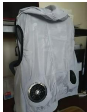
ポリエステル製 フード付ベスト