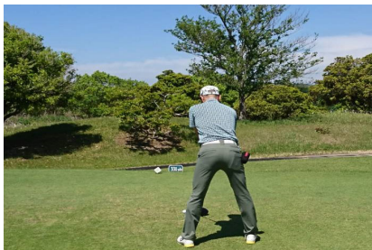
写真は児玉雄志プロ?の見事なスタンス ...らしいです イエイ