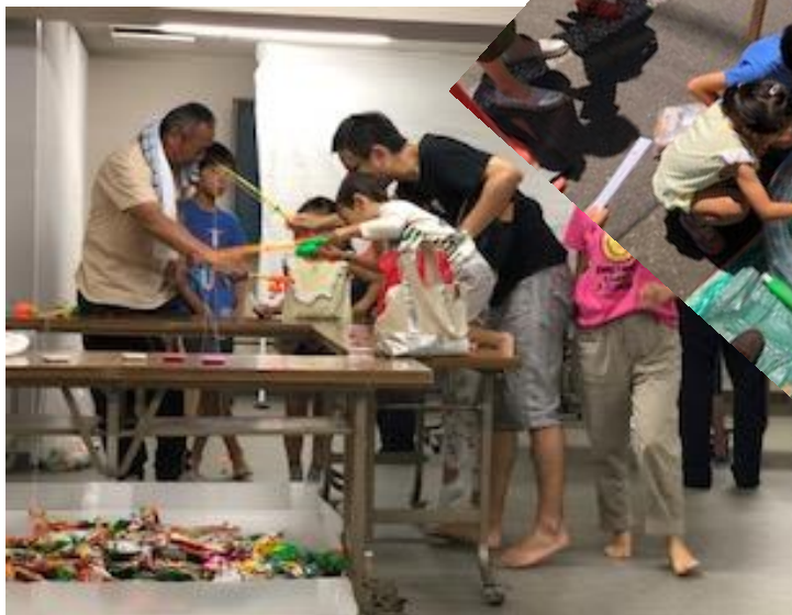
魚釣りゲーム しかしてその実態は御菓子釣り