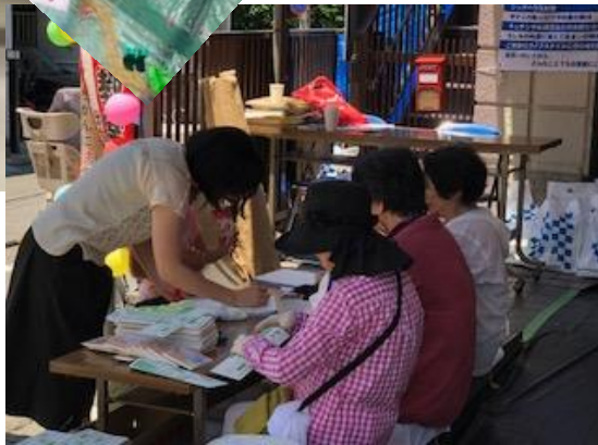
受付の美女連と木工教室