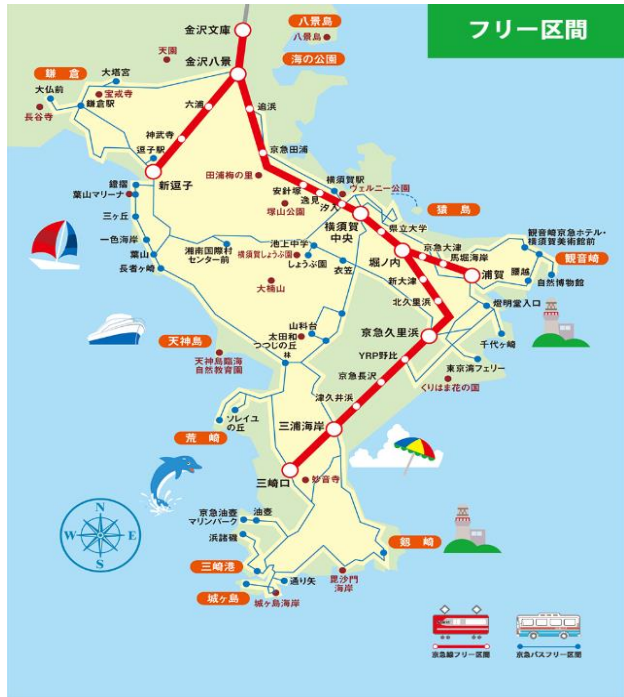
どこへ遊びに行こうかな～？