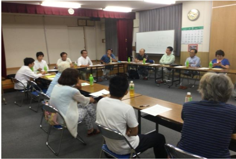
意見交換会の様子 群長さんからいろいろ意見を伺いました

先月27日(水)南雪谷自治会館にて昨年からは始まった意見交換会がありました。 今年「後継者対策」をテーマに各郡の群長さんから意見を頂きました。大田支部では分会のあり方についていろいろと提案をされていますが、なかなか伝わっていないのが現状です。それでも各郡は新しい役員のなり手がいない中、各郡、工夫して群役員を出しています。 組合の構成として役員を選ぶ必要があることは分かっていますが、自分の時間を新たに組合に費やすという事は抵抗がある人多いと思います。しかし仲間のある人が力となってくれるのは弱っていき一方です。今までは利用している制度も値上げや制限・廃止になってしまっています。 組合の維持・発展は組合員のみならず、分会でも少しでも楽しく、ためになる、参加しやすい分会をめざしていろいろと悩んでいます。 皆さんの意見・質問をいつでもお待ちしております。